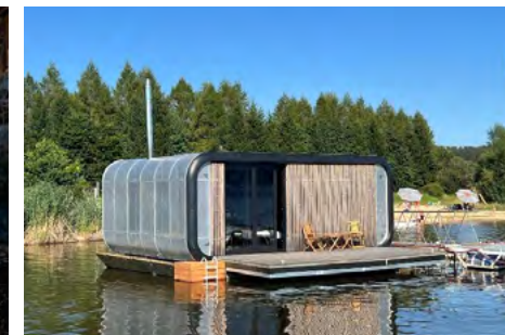
Obr. 17 – Hausbót