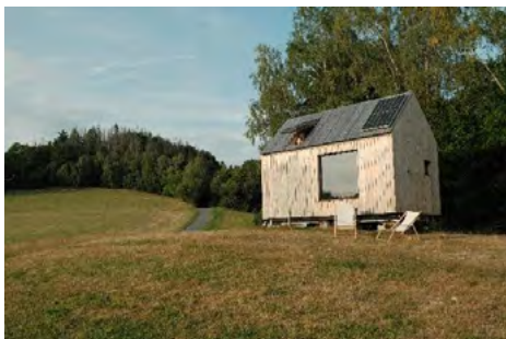
Obr. 7 – Příklad tiny houses v České republice