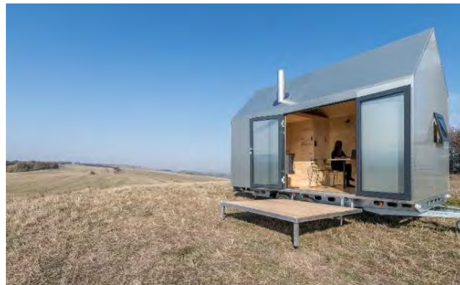
Obr. 13 – Příklad mobilního ubytování registrovaného jako přípojné vozidlo

Za tiny houses se dají považovat i objekty jako jsou maringotky, domy na stromech, různé obytné posedy, drobné stavby z kontejneru apod. Každý objekt má sice vlastní specifické znaky, ale česká legislativa se na ně zřejmě bude koukat podobně a budou považovány za stavbu, tzn. vztahuje se na ně legislativa dle stavebního zákona (Zákon č. 183/2006 Sb.). To se týká i objektů mobilních, protože dle platné legislativy se mobilní domy považují za „výrobek plnící funkci stavby“ a jsou na ně kladena stejná pravidla jako na stavby. (Ministerstvo pro místní rozvoj ČR, 2013) V českém prostředí tedy ani mobilní objekty nemají výjimku a musí podstupovat proces povolování. Tyto objekty zastupuje třeba typická maringotka, která je v ČR celkem častým ubytováním, nebo i nové objekty, které jsou vybaveny podvozkem. Některé ubytování může být i registrováno jako přípojné vozidlo, ale i tak je při dlouhodobém stání považováno za stavbu. Při takovém pravidle by do kategorie spadaly třeba i karavany, když jsou dlouhodobě umístěné na jednom místě, které není zamýšleno jen jako parkování.