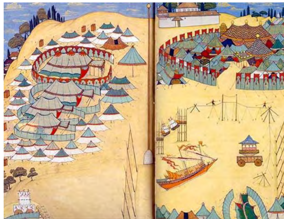
Obr. 5 – Stanové městečko kolem Bosporu, 1720 (Autor: Abdulcelil Levni)

I když glamping působí jako nový moderní trend, podobné typy obydlí používali lidé již dávno v historii. Například použití velkých luxusních stanů lze nalézt již u Osmanské říše, která je využívala jako přesuvná obydlí. (Soth, 2019)