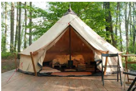
Obr. 1 – Příklady komfortního glampingového ubytování