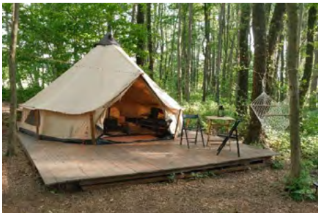
Obr. 14 – Teepee stan (N. Puchelová)

Další skupinou ubytování jsou stany a podobné lehké konstrukce, jako jsou geodetické kupole či „bubble hotely“. Jak již bylo zmíněno dříve, stany mají již dlouhou historii, i dnes mají v glampingu své nezpochybnitelné místo, jsou celkem časté a populární. Tyto objekty se liší od tradičních stavebních konstrukcí, většinou jsou vyrobeny z textilu nebo průhledných plastů, podepřené dřevěnými či kovovými prvky. Díky své konstrukci jsou skladné a přemístitelné, často jsou používány pouze sezónně. Nicméně jsou vybaveny nábytkem, a tak jejich přemístění není snadné, i když se jedná o lehkou konstrukci.