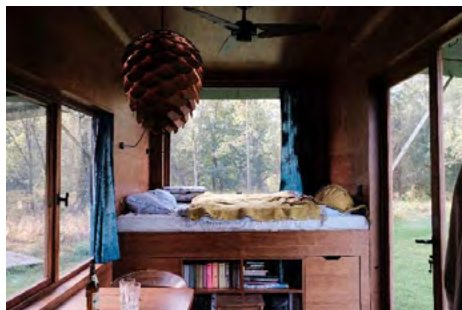
Obr. 10 – Příklad řešení interiéru

Objekty tiny houses můžeme dělit dále ještě na mobilní a nemovité objekty. Spousta objektů je totiž postavena na podvozku a je tak možné je přesunout i na jiná místa. Ve většině případů se nejedná o úplně jednoduchý převoz, takže se nepřesouvají často, nicméně v případě potřeby to je možné. Naproti tomu lze najít i tiny houses nemovité, obzvláště ty, které jsou navrženy specificky přímo na určité místo, například domy na stromech. Tyto objekty pak možnost přemístění ztrácejí, ačkoliv obecně stavby glampingových ubytování bývají celkem jednoduché a tím i přemístitelné.