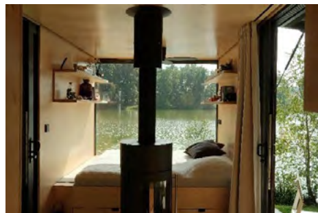
Obr. 2 – Příklady komfortního glampingového ubytování

Práce se soustředí na minimální alternativní typy ubytování v ČR, které mají zastavěnou plochu ubytování do 25 m 2 . Zahraniční definice tiny houses udávají různé velikosti plochy, většinou okolo 30 m 2 , ale lokálně se typologie objektů mění podle socio-kulturních vlivů a také podle místních podmínek legislativy. Jako příklad socio-kulturního vlivu lze uvést tiny houses v americké či australské společnosti, kde se fenomén těší velké oblibě. Jsou to místa, kde se dlouhodobě projevuje trend „čím větší, tím lepší“, a tak jsou nejen rodinné domy obecně větší, ale týká se to i trendu tiny houses, kde mluvíme většinou o stavbách do cca 40 m 2 . (Anson, 2014) Hranice 25 m 2 byla ve výzkumu zvolena s ohledem na legislativní podmínky stavebního zákona, který na takto malé domy má několik výjimek. I proto má většina glampingového ubytování v ČR rozlohu stavby právě do 25 m 2 , a tak tato podmínka přiměřeně ohraničila výběr minimálního ubytování.