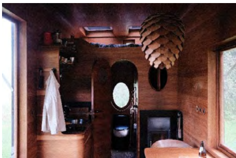
Obr. 9 – Příklad řešení interiéru

Tiny houses jsou většinou solitérní objekty, které jsou jednopodlažní. Interiér je pak řešen dle předchozího popisu glampingu – minimalistické ubytování ve většině případů s jednou místností, kde se slučují všechny potřebné funkce ubytování.