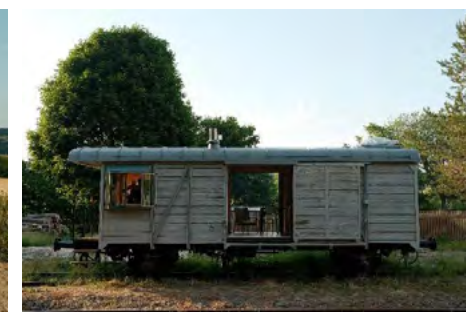
Obr. 19 – Obytný automobil a ubytování v opraveném vagonu