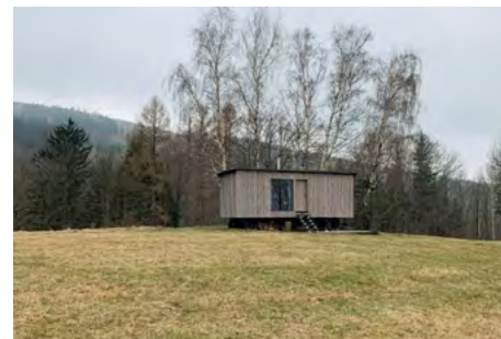
Obr. 2 – Příklady glampingového ubytování

Glamping má několik společných charakteristických vlastností – jedná se o malé objekty, a tudíž jde o celkem minimalistické ubytování. Glampingové ubytování je typické tím, že se většinou jedná o jednu otevřenou obytnou místnost, která slouží jak prostor pro spaní, pobyt, vaření, stolování, případně i pro hygienu. Je tedy nutná promyšlená dispozice prostoru a vhodné slučování funkcí. Často se také používají dispozičně výhodná spací patra, která umožňují pomyslné oddělení spací části a zároveň využití prostoru pod nimi. Některé ubytování disponují i hygienickým zázemím včetně sprchy nebo třeba i sauny, ať už v objektu či v exteriéru, nicméně celkem často je možné nalézt jen venkovní toaletu. Omezený vnitřní prostor vybízí návštěvníky k pobytu venku, na objekt většinou navazuje terasa, která rozšiřuje pobytový prostor do exteriéru. Venkovní vybavení podporuje celodenní využití v exteriéru, samozřejmostí je venkovní nábytek, často se zde objevuje gril, případně i wellness prvky (sauna, finská kád). Propojení s exteriérem je podstatou glampingového ubytování, ať už se projevuje ve formě velkorysých výhledů z ubytování, zajímavého umístění objektu či přímého propojení s okolní přírodou.