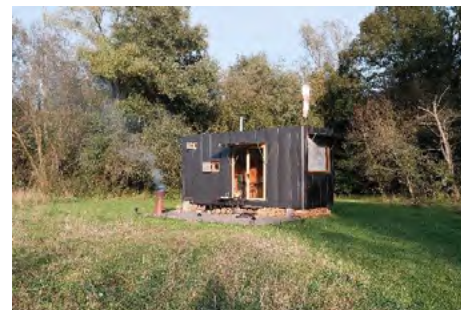
Obr. 11 – Příklad mobilního a nemovitého objektu glampingu

Objekty tiny houses můžeme dělit dále ještě na mobilní a nemovité objekty. Spousta objektů je totiž postavena na podvozku a je tak možné je přesunout i na jiná místa. Ve většině případů se nejedná o úplně jednoduchý převoz, takže se nepřesouvají často, nicméně v případě potřeby to je možné. Naproti tomu lze najít i tiny houses nemovité, obzvláště ty, které jsou navrženy specificky přímo na určité místo, například domy na stromech. Tyto objekty pak možnost přemístění ztrácejí, ačkoliv obecně stavby glampingových ubytování bývají celkem jednoduché a tím i přemístitelné.