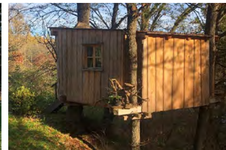
Obr. 12 – Příklad mobilního a nemovitého objektu glampingu

Za tiny houses se dají považovat i objekty jako jsou maringotky, domy na stromech, různé obytné posedy, drobné stavby z kontejneru apod. Každý objekt má sice vlastní specifické znaky, ale česká legislativa se na ně zřejmě bude koukat podobně a budou považovány za stavbu, tzn. vztahuje se na ně legislativa dle stavebního zákona (Zákon č. 183/2006 Sb.). To se týká i objektů mobilních, protože dle platné legislativy se mobilní domy považují za „výrobek plnící funkci stavby“ a jsou na ně kladena stejná pravidla jako na stavby. (Ministerstvo pro místní rozvoj ČR, 2013) V českém prostředí tedy ani mobilní objekty nemají výjimku a musí podstupovat proces povolování. Tyto objekty zastupuje třeba typická maringotka, která je v ČR celkem častým ubytováním, nebo i nové objekty, které jsou vybaveny podvozkem. Některé ubytování může být i registrováno jako přípojné vozidlo, ale i tak je při dlouhodobém stání považováno za stavbu. Při takovém pravidle by do kategorie spadaly třeba i karavany, když jsou dlouhodobě umístěné na jednom místě, které není zamýšleno jen jako parkování.