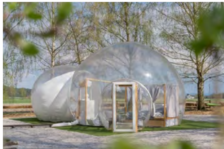
Obr. 15 – „Bubble hotel“

Stany mají obvykle tvar teepee („týpí“) nebo podobný tvar, který nabízí velký vnitřní prostor. Glampingové stany bývají bohatě vybavené nábytkem, což zajišťuje komfort srovnatelný s tiny houses, i když nemají pevné stěny. Pobyť ve stanu může být tedy stejně pohodlný jako v jiných glampingových objektech, zejména v letních měsících, kdy není nutné prostor vytápět. Proto jsou stany často využívány pouze sezónně, alespoň v České republice. Stany bývají většinou postavené na pevné terase, což opět propojuje vnitřní prostor s exteriérem.