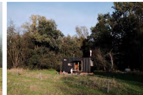
Obr. 3 – Příklady glampingového ubytování