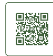
Obr. 21 – Odkaz na interaktivní mapu