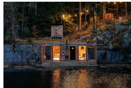
Obr. 16 – Glamping na vodě

Co se týče legislativy a procesu povolování stavby, na vodní hladině je situace odlišná – domy na vodě jsou posuzovány jako vodní dílo dle Vodního zákona 254/2001 Sb. a mají tak jiné podmínky než objekty posuzované jako stavby.