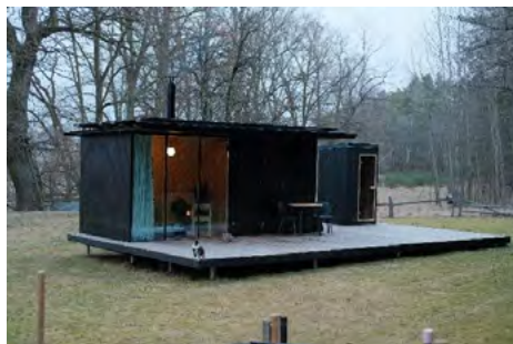
Obr. 8 – Příklad tiny houses v České republice

Tiny houses jsou většinou solitérní objekty, které jsou jednopodlažní. Interiér je pak řešen dle předchozího popisu glampingu – minimalistické ubytování ve většině případů s jednou místností, kde se slučují všechny potřebné funkce ubytování.