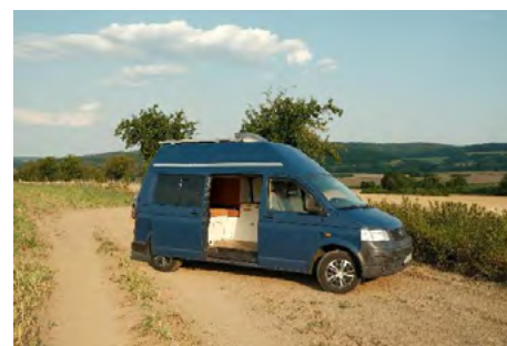
Obr. 18 – Obytný automobil a ubytování v opraveném vagonu

V této skupině nejde jen o obytné automobily, ale mohou to být třeba i karavany, různé přívěsy apod. Zajímavostí mezi obytnými dopravními prostředky jsou pak opravené vagony, které slouží k ubytování. Jelikož se jedná o objekt na kolejích, situace je značně odlišná od zmíněných předchozích staveb, jejich umístění a tím i povolení totiž spadá pod Správu železnic.