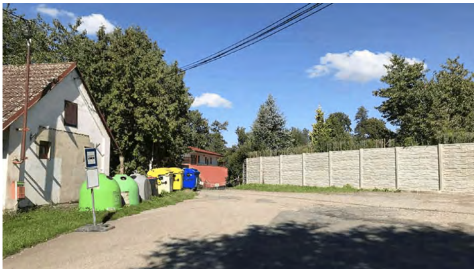
Obr. 2 – Rozšířené veřejné prostranství v centru obce