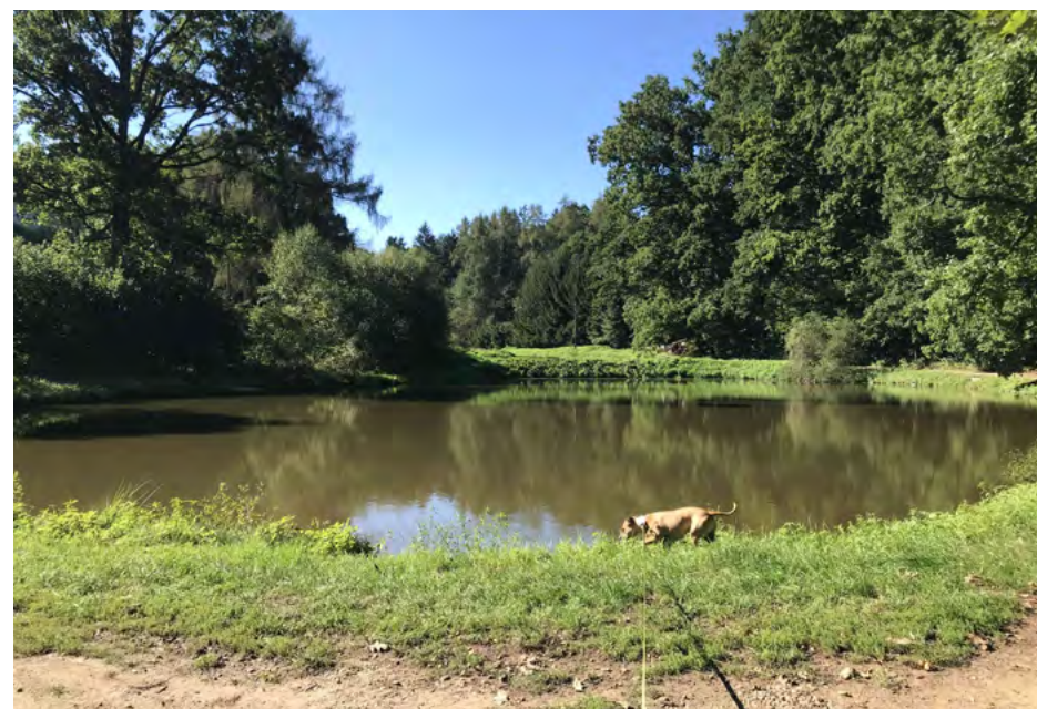
Obr. 6 – Chovné rybníky nacházející se v původní části Tvoršovic