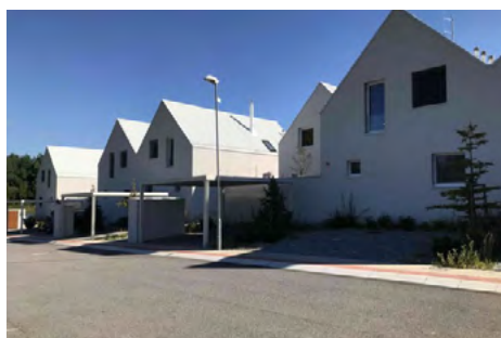
Obr. 10 – Řešení a návrh parkovacích ploch v komplexu Green Village