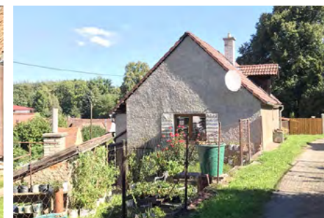
Obr. 17 – Řešení předzahrádek v původní části Tvoršovic x