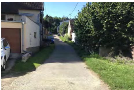
Obr. 3 – Vedlejší uličky původního sídla Tvoršovice