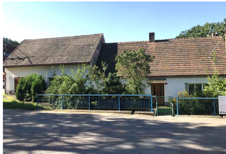
Obr. 5 – Protékající potok a jeho přirozené oddělení prostoru veřejného a soukromého (foto A. Abelová)