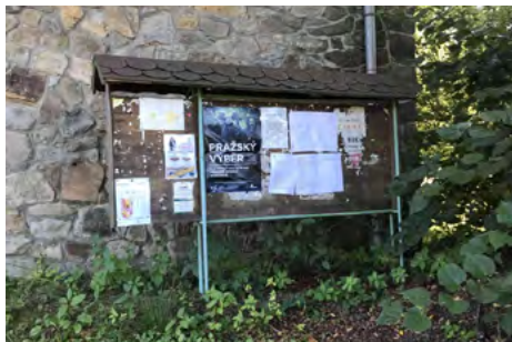
Obr. 13 – Informační nástěnka v původní části Tvoršovic

Mezi drobné architektonické prvky, které se v Green Village zatím nacházejí, patří umístění ohniště na travnaté ploše při vstupu do území (Obr. 8). Ohniště, jako intervence, nabízí možnost setrvání ve veřejném prostoru a podporuje vznik nebo udržování místní komunity. Je umístěno osamoceně uprostřed travnaté plochy. Tato intervence působí neformálně a autenticky, avšak zároveň může být vnímána jako neúctná. Může se stát příležitostí pro kreativní dotvoření veřejného prostoru samotnými obyvateli.