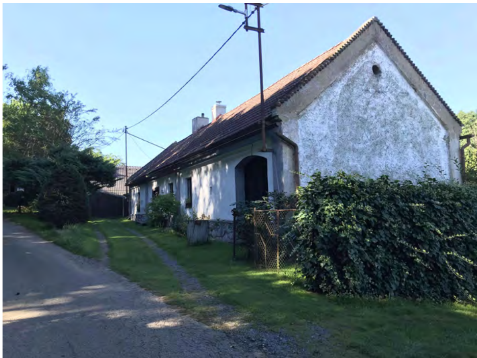
Obr. 15 – Řešení předzahrádek v původní části Tvoršovic