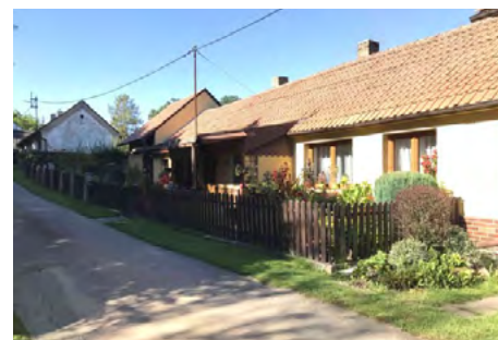
Obr. 16 – Řešení předzahrádek v původní části Tvoršovic