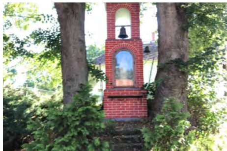
Obr. 14 – Zvonice v původní části Tvoršovic