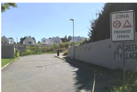
Obr. 9 – Vstup a vjezd do objektu