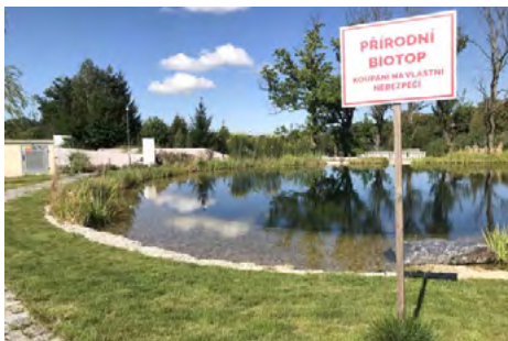
Obr. 7 – Rybník v komplexu Green Village