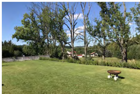
Obr. 8 – Ohniště v komplexu Green Village