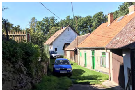
Obr. 4 – Vedlejší uličky původního sídla Tvoršovice