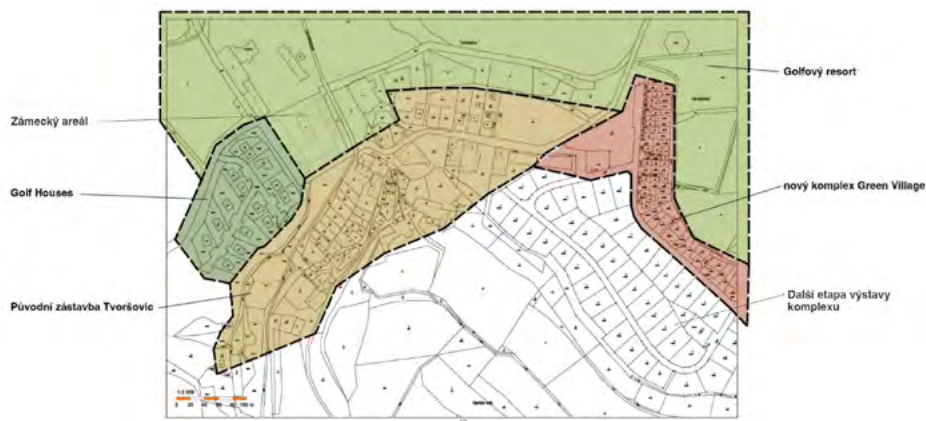
Obr. 1 – Jednotlivé části sídla Tvoršovice na podkladu katastrální mapy