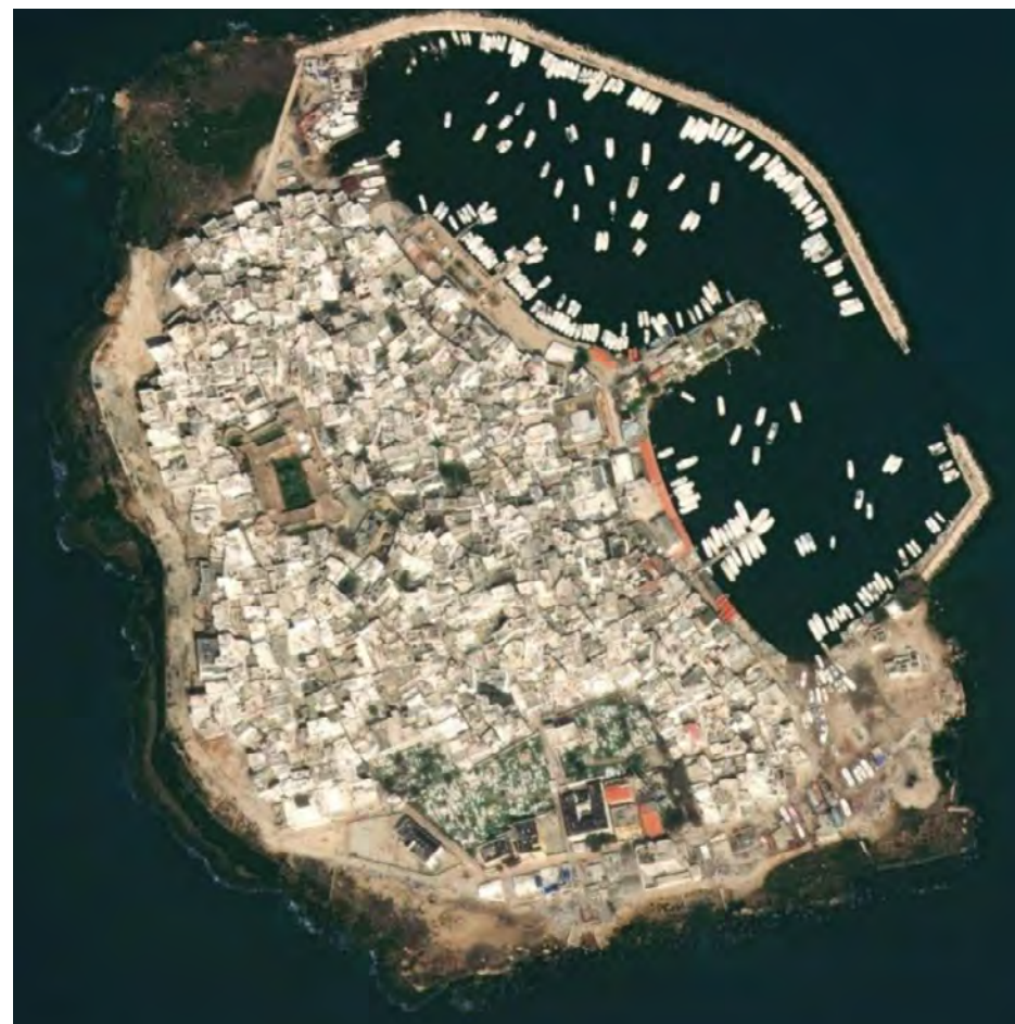
Obr. 2 – Současná urbánní struktura Arvadu.

Za zmínku stojí, že pitná voda se zde, stejně jako v dalších fénických městech (zejména ostrovních), získávala z velkých cisteren shromažďujících dešťovou vodu. Zajímavá je ale Strabónova zmínka (XVI, 2.13), že „obyvatelé Arvadu využívali pramene tryskajícího přímo v moři: na místě výtrysku umístili olověný zvon, z něhož voda odtékala koženou rourou a zásobovala město na ostrově“.