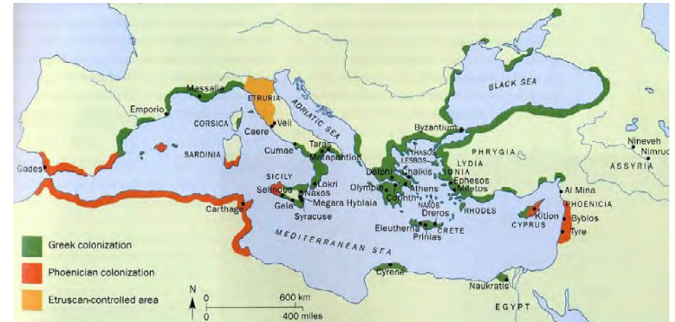
Obr. 8 Střet Fénické a Řecké kolonizace ve Středomoří.

Fénická kolonizace se samozřejmě dříve či později musela střetnout s nastupující kolonizací řeckou. Z tohoto hlediska je pro nás podstatná až její druhá vlna – tzv. Velká řecká kolonizace, datovaná až mezi roky 755–535 př. Kr. (Oliva, 1995), tedy víceméně o 300 let později. Řekové se v této době obrátili se svými kolonizačními tendencemi do středního a západního Středomoří, kde již ale měli své kolonie a emporia právě Féničané. Na řadě míst, zejména v severní Africe a na dalekém západě se je podařilo Féničanům udržet, jinde svůj původní prostor ztratili. Zde můžeme uvést jako příklad východní Sicílii, kde z hlediska lokalizace se zdá, že založení jak Syrakus na ostrově Ortigia, tak i o cca 20 km severněji položeného Thapsu, odpovídá spíše fénickým zvyklostem zakládání měst – na ostrově při pobřeží, než způsobu řeckému, neboť Řekové preferovali lokality ležící přímo na pevnině. (To je konečně pěkně viditelné právě v případě Syrakus, kdy po jejich „založení“ resp. převzetí Řeky město záhy expandovalo na pevninu založením tzv. Nového města (Neapolis) (Parco Archeologico della Neapolis, © 2023). Řekové tak obsadili nejen východní Sicílii, ale zejména jižní Francii a východní pobřeží Španělska. Přestože je dnes považujeme (patrně neprávem) za kulturně vyspělejší než byli Féničané, je nesporné, že rané urbánní struktury ve středním a západním Středomoří mají zejména fénický původ.