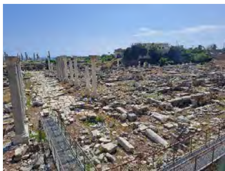
Obr. 6 – Celkový pohled na archeologickou lokalitu na bývalém ostrově v Týru. Zdroj: vlastní foto 25.5.2023