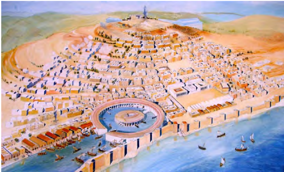
Obr. 11 Rekonstrukce urbánní struktury Kartága.