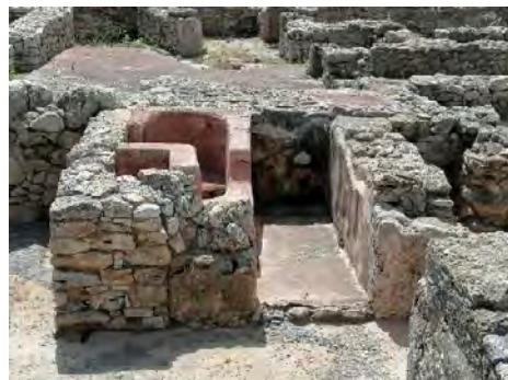
Obr. 14 Koupelna s vanou v jednom z obytných domů.

Kerkouane pravděpodobně nebylo jedním z nejvýznamnějších fénických / punských sídlišť na západě, ale díky jeho zachovalosti nám dává (na rozdíl od jiných) velmi pěknou představu o struktuře a vybavenosti fénických a punských sídlišť.