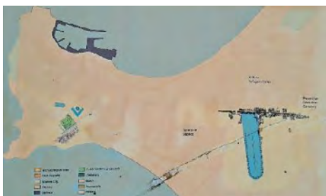
Obr. 5 – Uspořádání Týru po jeho propojení s pevninou.