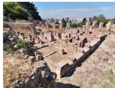
Obr. 9 – Pozůstatky punských domů na pahorku St. Luis – Byrsa.