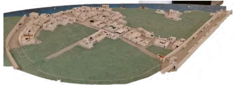
Obr. 12 Model odkrytých částí Kerkouane. Zdroj: Archeologické muzeum Kerkouane, vlastní foto 17.6.2021