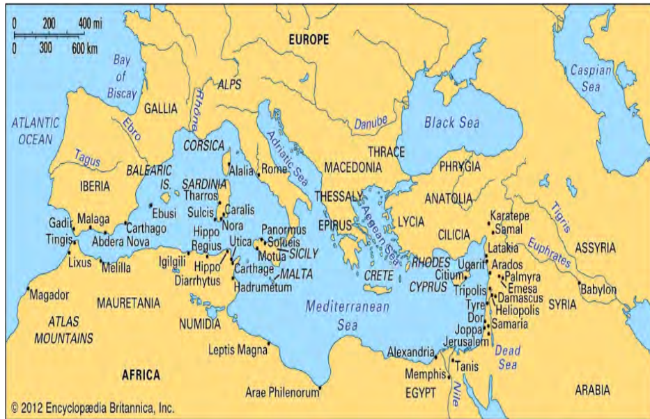
Obr. 7 Mapa fénických kolonií ve Středomoří.

Fénická města se věnovala většinou námořnímu obchodu. Pozdějšími výboji si zajišťovala zázemí, aby z něho mohla zásobovat potravinami své stále rostoucí obyvatelstvo. Do nově základních měst byl umisťován přebytek obyvatelstva z měst stávajících a rozrůstala se i obchodní síť, vlastní základ života měst. Tak na Lybijském pobřeží byla města Leptis Magna, Oia a Sabratha středisky karavanního obchodu, který směřoval přes Saharu do afrického vnitrozemí a do zemí při Guinejském zálivu. Dalšími fénickými resp. pozdějšími punskými městy byla Bizerta a Annába a jejich řetěz pokračoval k západu přes dnešní Alžír (Icosium), Tandžu (Tingi) po Rabat a Magador. (Votrubec, 1980, str. 152)