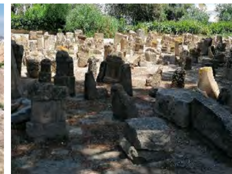
Obr. 10 – Kartaginský tofet.