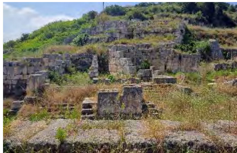
Obr. 3 – Pozůstatky Ešmunova chrámu v Sidónu.