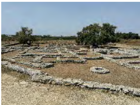
Obr. 13 – Pozůstatky urbánní struktury (s maqom v místech stromů vpravo).