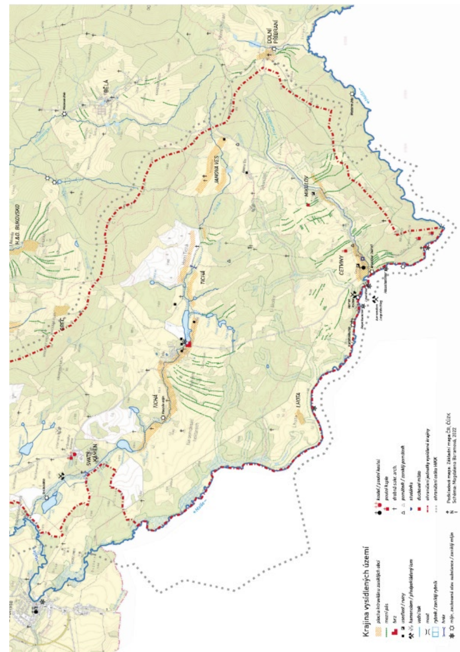
obr. 2 – Schéma znaků jednotky Krajina zaniklého městečka Cetviny

Neméně zajímavou připomínkou lidové zbožnosti je kamenná mísa nad Mikulovem, opředená pověstí o Svaté rodině, která do těchto končin zabloudila při útěku z Egypta. Panna Maria hledala místo, kde by mohla Ježíška omýt a přilehlý balvan se nad ní slitoval a vytvořil v sobě prohlubeň, jež se naplnila teplou vodou. Je to tedy další případ, kdy byl v regionu kámen asociován se zázrakem, podobně jako balvanu ve Svatém Kameni. Mimo tato výrazná duchovní místa je oblast protkána soustavou desítek prostých křížků a kapliček, které často zdánlivě stojí bez jakéhokoli kontextu uprostřed pastvin, ale dokládají někdejší průběh cest, které byly po vysídlení zahlazeny.