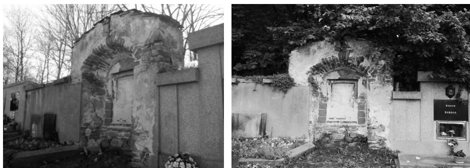
obr. 4 – Fragments křížové cesty umístěné v rámci hřbitovní zdi

Před vchodem do hřbitova byl v roce 1916 umístěn pomník padlých světové války. Na podstavci z opracovaného kamene je postava muže opírajícího se o ruku. Autorem pomníku je sochař a grafik Antonín Bílek (1881-1937). Na pomníku je nápis Padlým a zemřelým hrdinům světové války. Červený kříž ve Strakonících . Každoročně se zde v době první československé republiky konala pietní vzpomínková shromáždění. V den vzniku republiky 28. října zde spolky pořádaly vzpomínkové shromáždění, na které navazoval průvod městem se zastávkami u rodného domu italského legionáře Vojtěcha Hally a rodného domu francouzského legionáře Boh. Tschinkla, kde byly osazeny pamětní desky, ke kterým zavěsili věnce. Druhé velké shromáždění u pomníku padlých, „Mírovou slavnost“, pořádal Československý červený kříž vždy v souvislosti s velikonočními svátky na Bílou sobotu (SOKA Strakonice). Pomník byl restaurován naposledy v roce 2002.