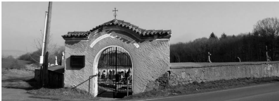
obr. 6 – Vstupní brána podsrpenského hřbitova

ke hřbitovu zákonné povinnosti, ač nebyla jeho majitelem. Stejně jako svatováclavský hřbitov byl do poloviny 20. století podsrpenský hřbitov hřbitovem církevním (konfesijním). K jeho údržbě byl zřízen vlastní hřbitovní fond. V zápisu se také odráží tehdy rozšířený strach ze zdánlivé smrti, proti čemuž se mělo čelit různými prostředky (zvonítko, zevnitř snadno otvíravé dveře). Leckde se to řešilo tím, že byl na paži mrtvého uvazován řetězem zvon, který se při sebemenším pohybu rozezní.