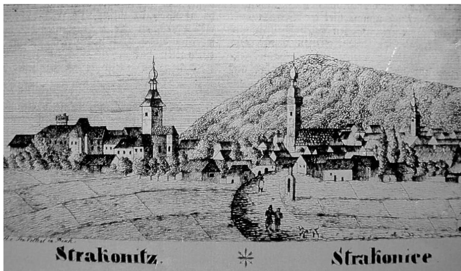
obr. 10 – Veduta Strakonice z 19. století s věžemi kostelů sv. Prokopa a sv. Markéty

Nářízení vlády č. 219/1949 Sb., o hospodářském zabezpečení církve římsko-katolické státem