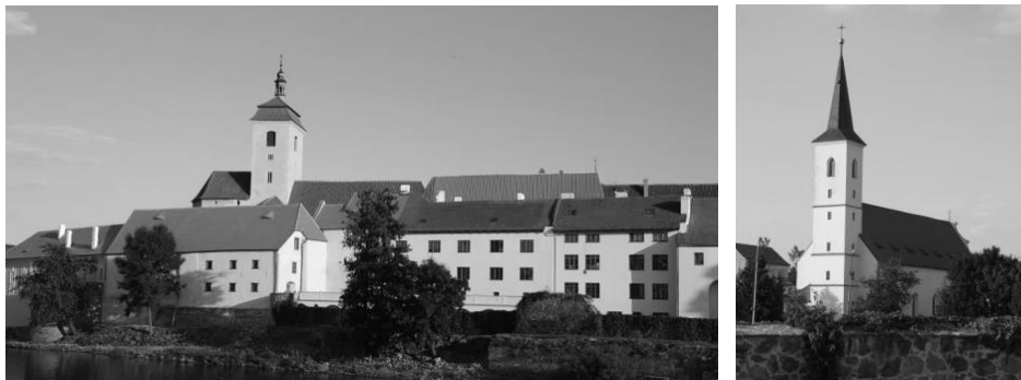
obr. 1 – Kostel sv. Prokopa (Vojtěcha) v areálu hradu a kostel sv. Markéty

ukazuje již na 12. století. Později byl zřízen hřbitov poblíž johanitské komendy, nejstarší církevní části hradu. Tento hřbitov se však už v průběhu středověku přestal používat. Do dnešní doby byla při různých příležitostných archeologických výzkumech v okolí objevena řada hrobů.