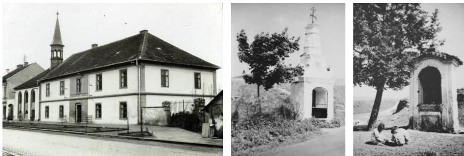
obr. 7 – kostelík sv. Martina a dvě kaple na hroby vojáků v Hradeckého ulici v období první republiky