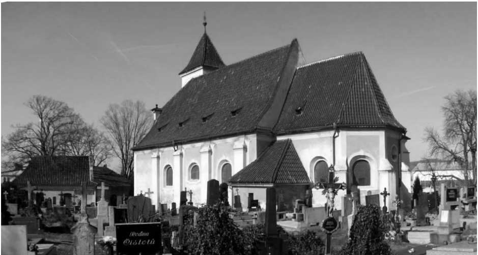
obr. 2– Kostel sv. Václava, vlevo kaple sv. Vojtěcha

Z pramenů můžeme rekonstruovat postupný plošný růst hřbitova , který dnes zaujímá značnou část půdorysu města. Hřbitov byl nejprve poměrně malý. Od konce 16. století, kdy se postupně stává hlavním strakonickým hřbitovem, docházelo k jeho opakovanému rozšiřování. Například v roce 1772, kdy postihl město hladomor, bylo tolik pohřbů, že musel být hřbitov rozšířen. Nejznámější veduta Strakonice z konce 18. století zachycuje zdi ohrazenou plochu jen v bezprostředním okolí kostela svatého Václava. Rozsah hřbitova na počátku 19. století je znázorněn v plánu stabilního katastru z roku 1837. Tehdy končil za hrobkou dědičných pošt mistrů. Okolí hřbitova silně ovlivnila stavba železnice a nádraží v letech 1867-1868. V průběhu 19. století značně vzrostl počet obyvatel ve městě a hřbitov přestával dostačovat. Dokládá to i přípis c. k. okresního hejtmána ze září 1876: (...) Tento hřbitov strakonický dle podaného úředního výkazu jenom výměru 9421l obsahuje a na něm v posledních desetiletích v průměru 248 mrtvol se pohřbívá, tedy uznávám, že hřbitov tento v tom stupni rozšířen býti musí, aby na každý hrob dvorním dekretem ze dne 23. srpna 1784 a 6. září 1787 předepsaná prostora vypadala. Potřebné kroky k tomuto rozšíření musí ve 2 měsících učiněny býti. (DÚ Strakonice, SOKA Strakonice)