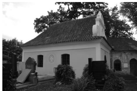
obr. 5 – Kaple Nejsvětější Trojice a kaple sv. Vojtěcha