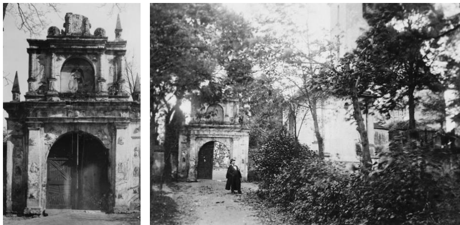
obr. 3 – Vstupní brána na počátku 20. století, před snesením barokního štítu

Před vchodem do hřbitova byl v roce 1916 umístěn pomník padlých světové války. Na podstavci z opracovaného kamene je postava muže opírajícího se o ruku. Autorem pomníku je sochař a grafik Antonín Bílek (1881-1937). Na pomníku je nápis Padlým a zemřelým hrdinům světové války. Červený kříž ve Strakonících . Každoročně se zde v době první československé republiky konala pietní vzpomínková shromáždění. V den vzniku republiky 28. října zde spolky pořádaly vzpomínkové shromáždění, na které navazoval průvod městem se zastávkami u rodného domu italského legionáře Vojtěcha Hally a rodného domu francouzského legionáře Boh. Tschinkla, kde byly osazeny pamětní desky, ke kterým zavěsili věnce. Druhé velké shromáždění u pomníku padlých, „Mírovou slavnost“, pořádal Československý červený kříž vždy v souvislosti s velikonočními svátky na Bílou sobotu (SOKA Strakonice). Pomník byl restaurován naposledy v roce 2002.