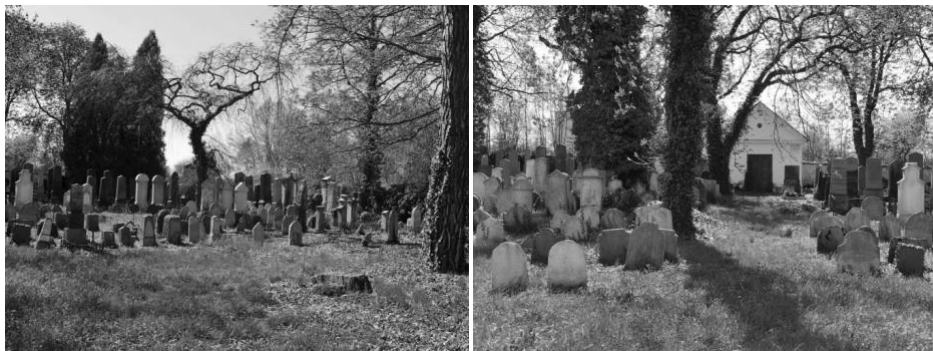
obr. 8 – Židovský hřbitov ve Strakonících

Hřbitov je obehnan vysokou kamennou zdí, jež měla zaručit ochranu hrobů před znesvěcením. V čele hřbitova je malý domek, který plnil funkci márnice. Jedná se o jednoduchou symetrickou stavbu s trojúhelníkovým štítem a valbou. Stavba je klenutá. Do bočních stran jsou prolomena okna s půlkruhovým obloukem. Štít hlavní fasády zdobený římsami je nesen dvěma pilastry s kompozitními hlavicemi. Byla postavena v 19. století, kdy byla také měněna rozloha hřbitova. Ještě na plánech stabilního katastru (1837) má hřbitov jiný tvar a je bez márnice. V rohu hřbitova je zřízena pumpa k symbolickému omytí rukou po skončení pohřebního obřadu.