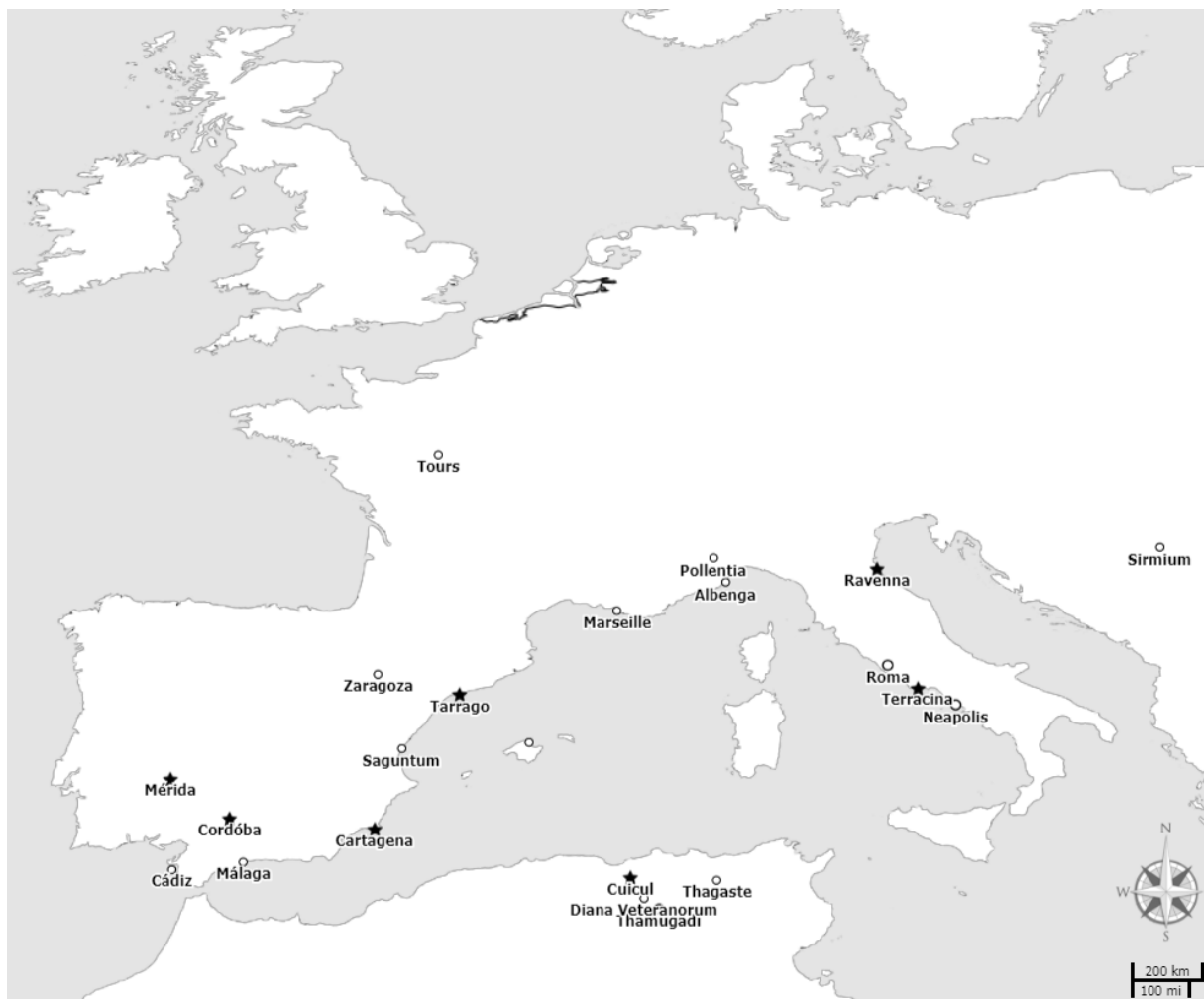
obr. 3 – Západní část římské říše s městy, zmíněnými v textu (Zdroj: mapový podklad Antiquity À-la-carte , 2012: Dostupné z http://awmc.unc.edu/wordpress/alacart ; popisky doplněné autorem)

Kulikowski (2005) uvádí následující tradiční interpretaci paradigmatu hispano-římského urbanismu v pozdní antice. Krize 3. stol. n. l. podle něj zničila starý městský pořádek, ve kterém měly kurie udržovat hlavní infrastrukturu měst a způsobila tak úpadek městského patriotismu u kuriálů. Ti nadále neinvestovali své finanční prostředky do zvelebení svého města, ale naopak se snažili svým povinnostem utéci do císařských nebo církevních služeb. Ve stejnou dobu se externí (barbarské vpády) i interní (občanské války, konkurence církve a městských kurií, zvýšená daňová zátěž) příčiny podílely na další destabilizaci vládnoucích elit, které trpěly ekonomickým úpadkem. Výsledkem bylo, že města upadala, monumentální architektura se rozpadala a hispano-římské elity utíkaly z měst na venkov. Hispánie prošla silným procesem ruralizace, kdy dominantní složka společnosti změnila své primární sídlo, a s touto změnou se přesunula politická i ekonomická moc na venkov. Města nadále sloužila „pouze“ jako sídliště pro biskupy a císařské úředníky. Tento názor byl udržován po mnoho dekad ve španělské vědecké komunitě archeologickými výzkumy, které explicitně spojovaly nalezené poznatky s kusými informacemi z narativních pramenů. Nové archeologické výzkumy nutí podle Kulikowskeho (2005) vědeckou komunitu revidovat tyto tradiční interpretace.