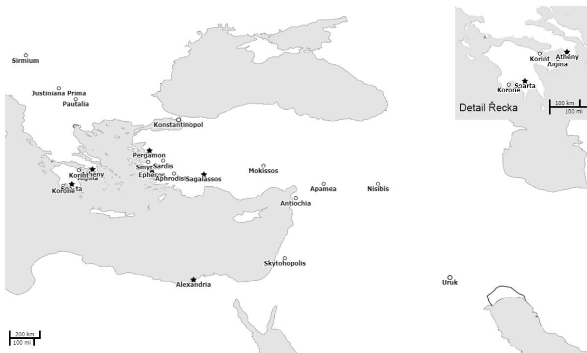
obr. 4 – Východní část římské říše s městy, zmíněnými v textu