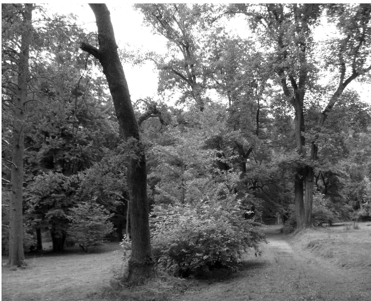
obr. 2 – Lesní arboretum Americká zahrada u Chudenic

Klasická barokní kompozice se v lesích objevuje především v podobě linií – průseků, někdy lemovaných alejemi, v různých geometrických uspořádáních. Tyto linie se váží na uzly v podobě objektů panských (lovecké zámečky, myslivny, letohrádky, loggie, gloriety, altánky, besídky či pavilony) i sakrálních (kaple, poustevny atd.). Části zalesněné obory tedy dělily sítě liniiových či paprscitých průseků, průhledů a alejí, umožňující bezpečnou jízdu několika jezdců vedle sebe. Zejména v loveckých oborách je klasická především šesti až osmiramenná hvězda související i se způsobem lovu, přičemž ve středu hvězdy stál zpravidla letohrádek (pavilon), přehledné pozorovací stanoviště i místo hodování po skončení lovu. Průseky se pak sbíhaly na volná prostranství, tzv. dostaveníčka (Tuma 2014). Na místech, kde se chovy zvířete udržely i do novější doby, stávaly se obory součástí nově budovaných přírodně-krajinářských parků a postupně ztrácely své výrazné geometrické členění.