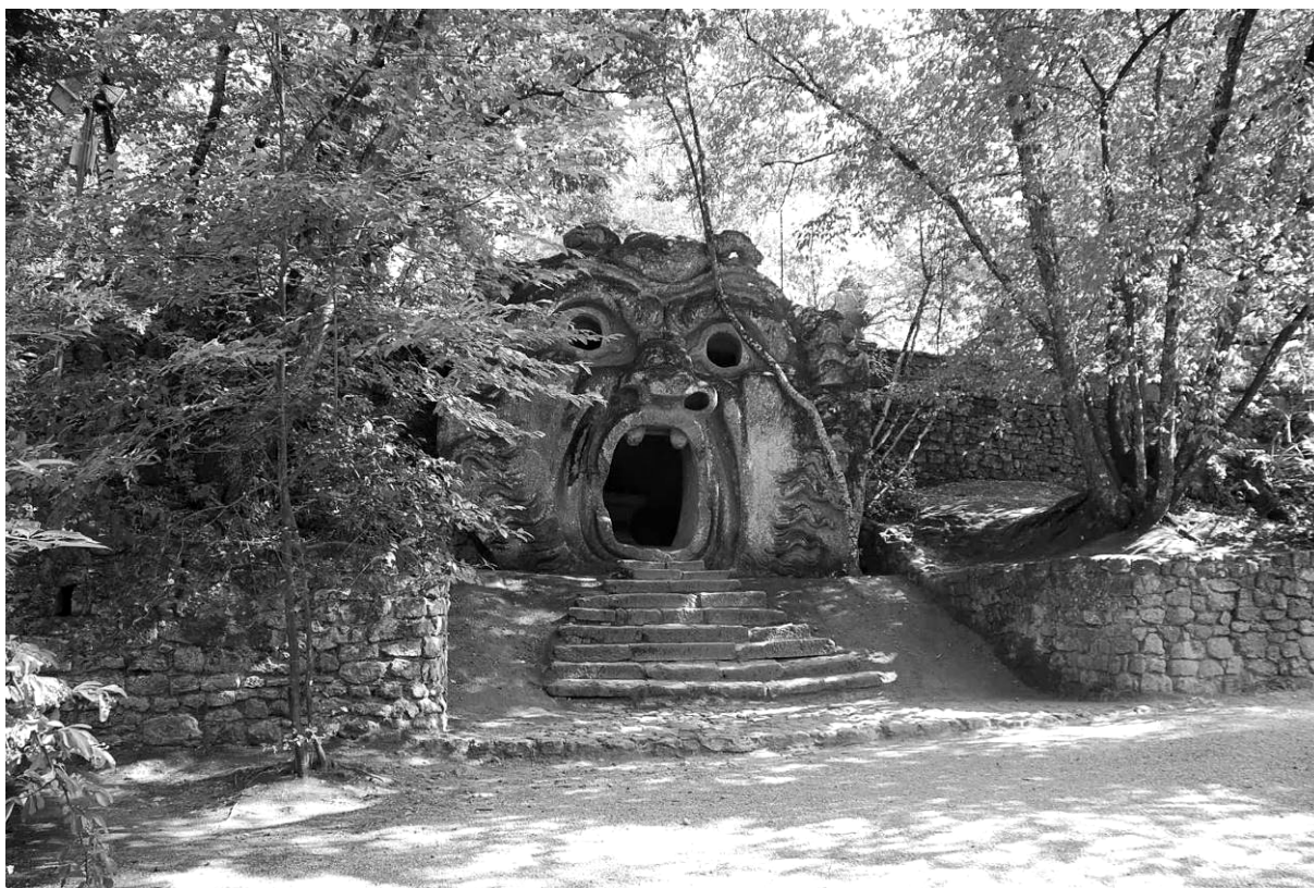
obr. 8 – Tajuplný les Sacro Bosco v Bomarzu

Těžiště většiny krajinných kompozic leží v období baroka, dokonce můžeme hovořit o barokní komponované krajině. Pozdější romantické krajinářské úpravy konce 18. a 19. století jsou pak spojeny především s přírodně krajinářským principem (lovecké a bukolické krajiny). Krajinářské úpravy 17. a 18. století však mají svou slavnou předeheru (především co do rozsahu) již v 16. století, kdy vrcholí velkorysé zakládání rybníčních soustav s řadou kanálů a stok na rožmberském Třeboňsku a pernětejském Pardubicku, dále na Chlumecku, Plzeňsku, Tovačovsku, Lounsku (Valtr 1986), Novohradsku, Blatensku, Lnářsku, Štětkeňsku a jinde, přičemž první ucelená rybníční soustava v Čechách vznikla již v 15. století na Hlubocku (Pavlátová 2007). Také první zmínka o klasické aleji je zaznamenána již v 16. století, kdy byla olemována cesta mezi Lvím dvorem na Pražském hradě a zámečkem ve Staré královské oboře (Velička 2010).