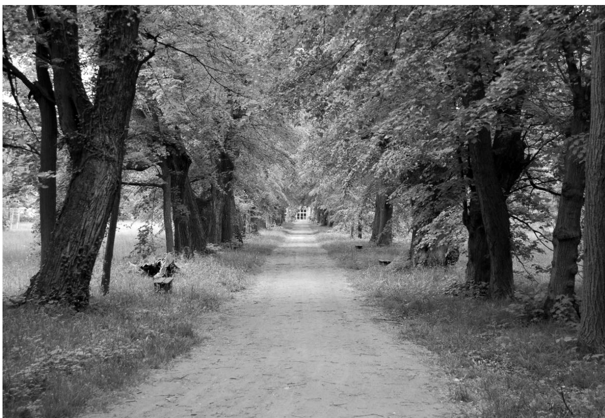
obr. 6 – Žehušická obora je proslulá chovem bílých jelenů, kteří se sem dostali již v roce 1780. Od roku 1920 je chráněna jako přírodní památka. Obrázek zachycuje přístupovou alej vedoucí od zámku k bráně obory

Zakládání nejstarších obor, které u nás spadá do druhé poloviny 13. (Tuma 2014) či první poloviny 14. století (Andreska 1980), se kryje se zaváděním kuší (samostřílů). Zatímco středověká jezdecká štvance byla prováděna v otevřených krajinách, vznikaly v souvislosti s přesunem lovu do obor nové techniky lovu. Kuše a obory se vzájemně doplňovaly. Mnoho nových obor vzniklo v 15. až 18. století, přičemž se v oborách chovala hlavně srnčí a jelení zvěř, daňci, prasata, mufloni i zvířata exotická (Andreska 1980, Tuma 2014). Obora se stala postupně symbolem prestiže svého majitele, přítomným téměř na každém významnějším panství. V období baroka se pak, jak již bylo uvedeno, stávala součástí komponované krajiny. Obvykle navazovala na formální zámecký park, kdy celá kompozice provázání zahrady s loveckou krajinou byla propojena a členěna průseky, cestami, vodními plochami, loukami a skupinami stromů. Vznikly tak jedny z nejrozsáhlejších komplexů estetizované krajiny.