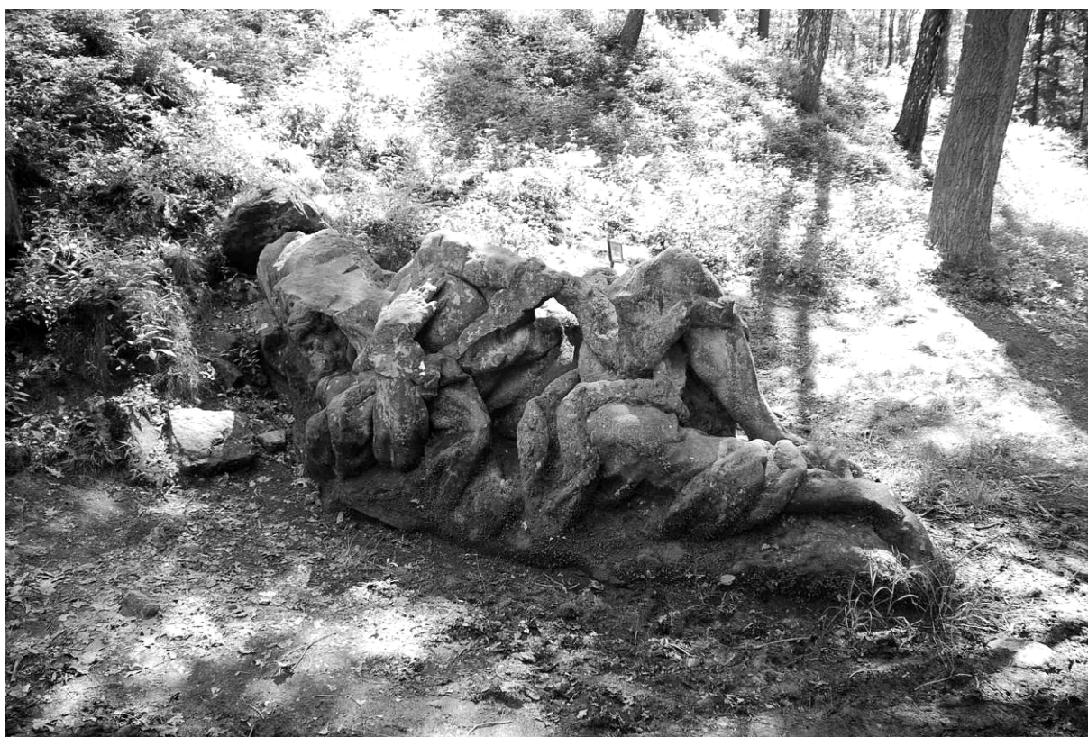
obr. 4 – Areál Nového lesa u Kuksu nazývaný Betlém je příkladem krajiny s velkým kulturně-historickým nábojem

S lesy je u nás spojena i tradice nejstarších poustev. Samota označována jako poušť, na kterou se první poustevníci skutečně uchylovaly, je míněna především duchovně a na našem území jí mohla být i zelená pustina lesa (Buben 2016).