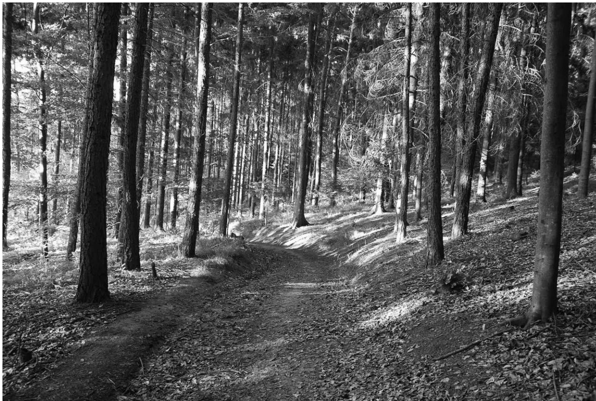
obr. 5 – Staré cesty v lesích jsou součástí historické krajinné struktury

Byť primárně nebyl důvodem vzniku takových historických struktur les, musely na jeho přítomnost reagovat, nebo byly díky přítomnosti v lese pozměněny a získaly novou hodnotu. Na pozůstatcích členění původní pluziny se například do současnosti někdy zachovaly významné staré polykormony, a to i mimo souvislé lokality starobyklých výmladkových lesů (Buček et al. 2017). Případem, kdy musela nějaká funkce reagovat na přítomnost lesa, jsou staré stezky a cesty, v krajině dodnes patrné v řadě fragmentů (úvozy, úpravy povrchů, zpevnění svahů atd.), které ovšem primárně nesouvisí s tím, že vedou lesem. Například je dodnes patrná část Zlaté stezky u Volar v podobě asi 2,5 m široké lesní cesty zajištěné oproti svahu nízkou terasní zídskou procházející vzrostlým smrkovým lesem na východním svahu vrchu Kamenáč (Památkový katalog NPÚ).