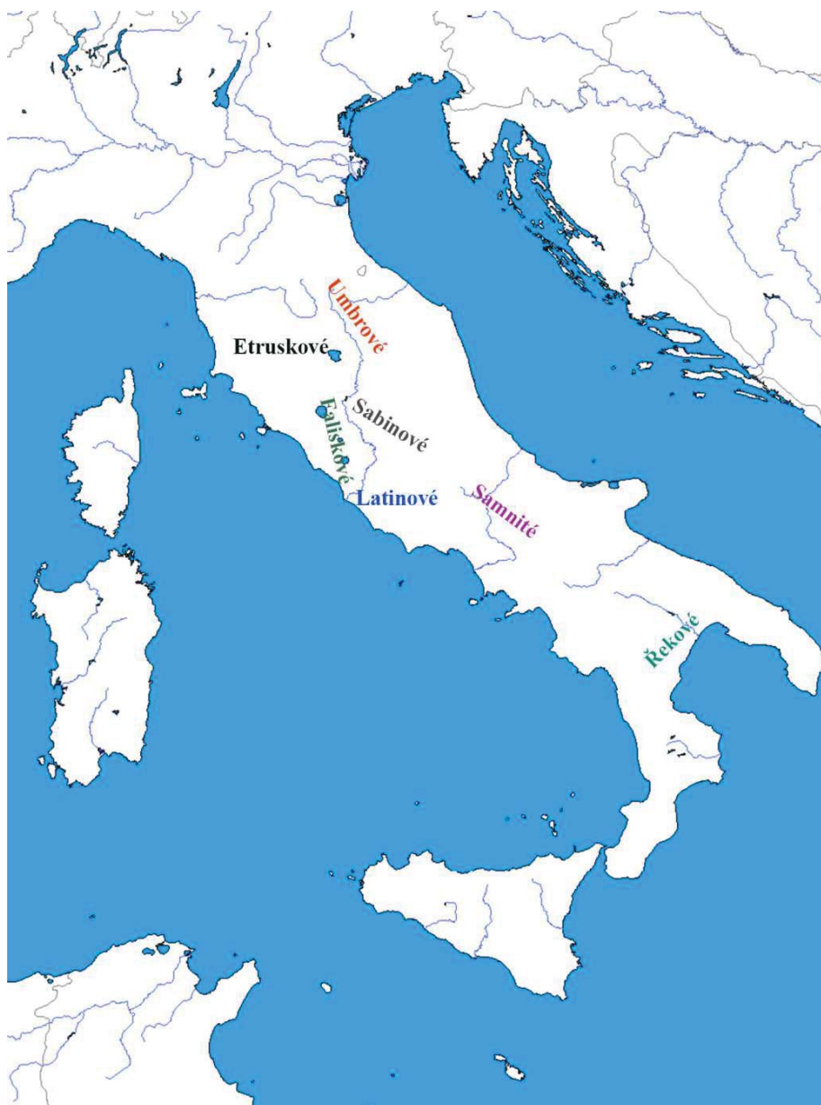
mapa 1 – Přibližná poloha kmenů a národů zmíněných v textu v pevninské Itálii