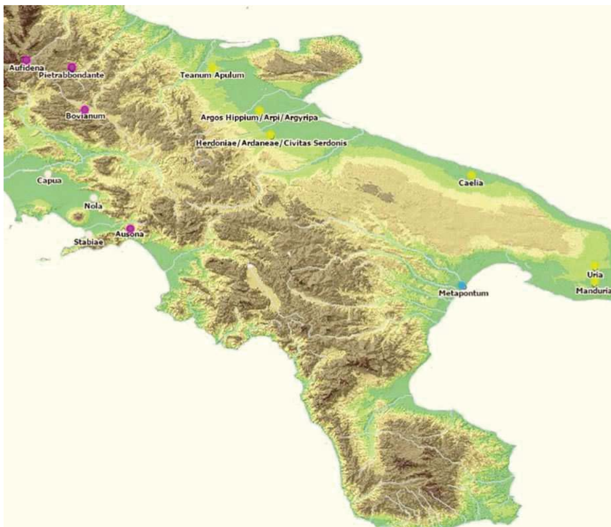
mapa 3: Některá sídliště zmíněná v textu