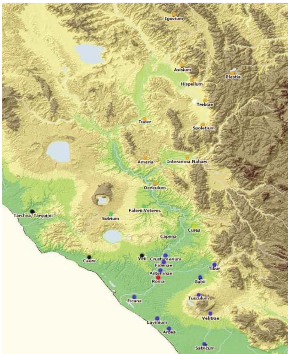
mapa 2 - Některá sídliště zmíněná v textu