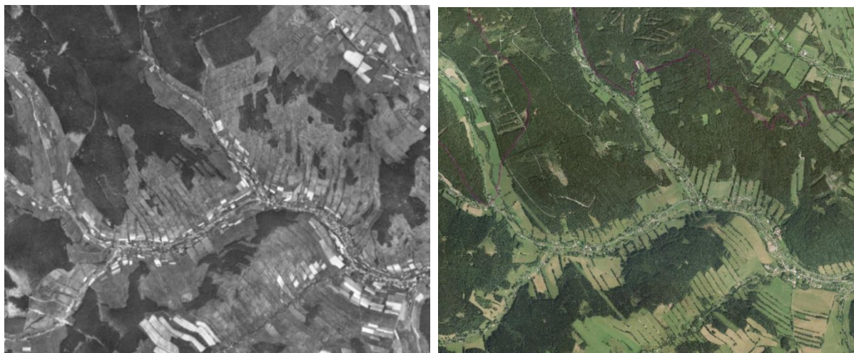
obr. 4 – Ztráta bezlesí – porovnání stavu území v r. 1955 a v r. 2012