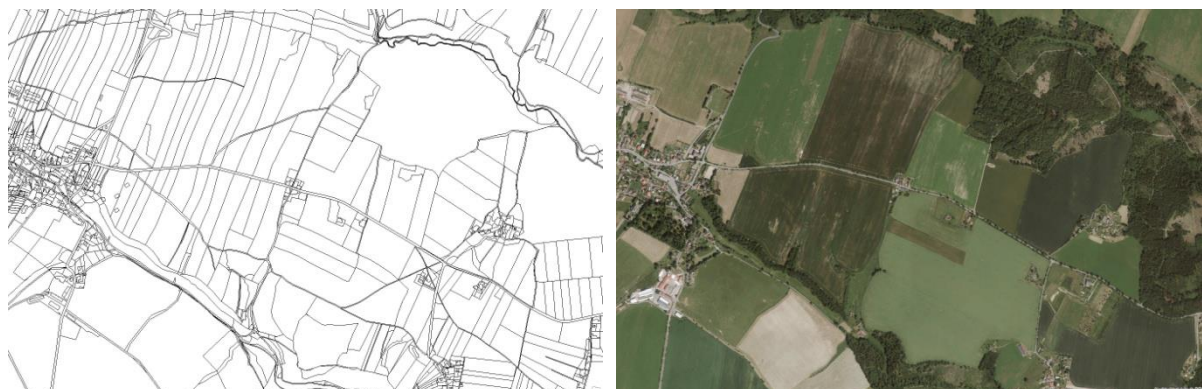
obr. 3 – Cestní síť podle pozemkového katastru a ve skutečnosti

vznikla komunikace pro pěší a cyklisty, která přispěje k rekreačnímu využití krajiny. Účinnějším nástrojem obnovy cestní sítě jsou pozemkové úpravy, které však bohužel postupují pomalu a někdy také bez koordinace s územně plánovací činností.