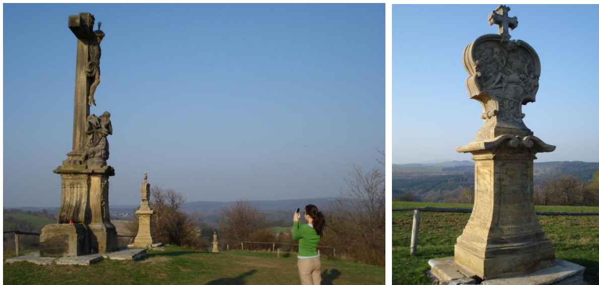
obr. 1 – Unikátní křížová cesta na Křížovém vrchu v Rudě u Tvrdkova

chráněny jsou pouze jednotlivé pískovcové sochy. Trasa křížové cesty vede vyšlapanou cestou, která není místní, ani veřejnou účelovou komunikací (viz obr. 1).