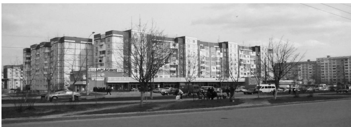
obr. 5 – Kišiňev, Ciocana, ulice Alleea Mircea cel Batran, Moldávie

V reakci na přílišné rezervy a vzdálenosti velkoryse plánovaných modernistických sídlišť, kde hlavní dopravní tepny tvoří široké bulváry, dochází nově ke vzniku celých „představených“ ulic (obr. č. 5–7). Většinou jsou tvořeny jedno až dvou podlažními objekty výhradně obchodního charakteru či poskytování služeb. Přirozeně tak vznikají nové obchodní třídy a ulice nesoucí znaky, které lze zahrnout do pojmu „městotvorné“, a které spoluvytváří svébytná a plnohodnotná centra na periferiích měst.