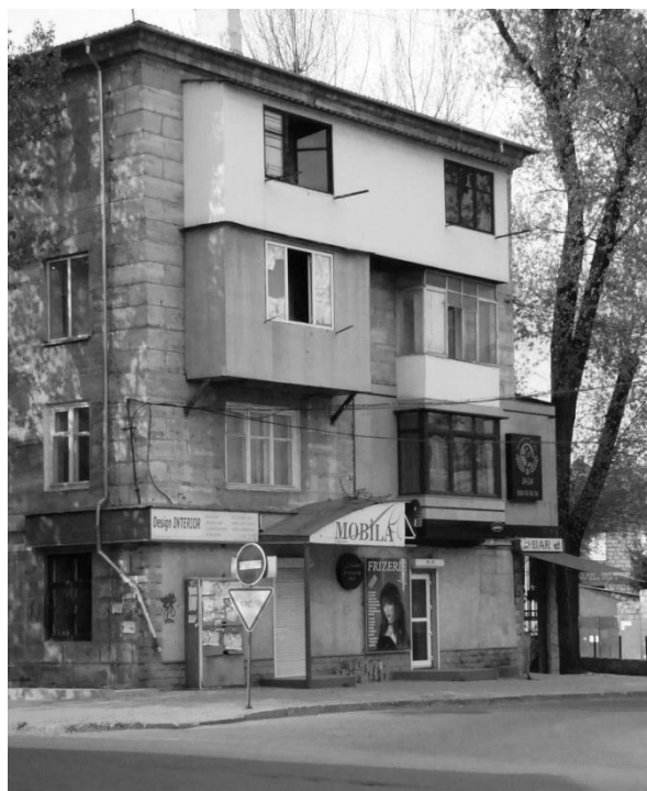
obr. 2 – Kišiňev, Strada Alexandru cel Bun, Moldávie

Je nutné poznamenat, že v naprosté většině případů se jedná o výrazné architektonické zásahy realizované bez spolupráce s architekty a úřady. Tato okolnost hraje významnou roli i v otázkách souvisejících s památkovou ochranou architektury druhé poloviny 20. století jak