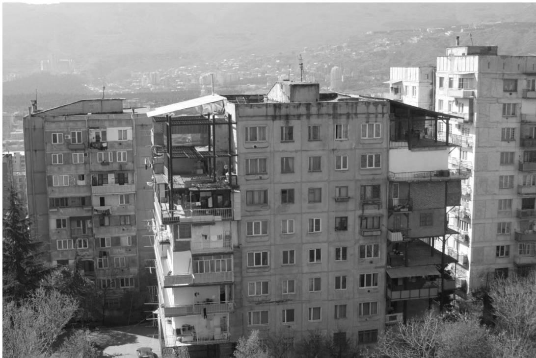
obr. 3 – Tbilisi, Nutsubidze Plato, Mikro-district 3, Blok 4, Gruzie

upozorňuje Asabashvili (2013). Nejenže se jimi zásadně pozměňuje charakter domu, ale v některých případech se jedná o odvážná řešení hraničící s únosností zvolených materiálů. Díky tomu se pro tento architektonický jev vžilo lokální označení Kamikaze Loggia , které se stalo i tématem gruzinského pavilonu 55. mezinárodní umělecké výstavy na benátském bienále v roce 2013 (Kamikaze, 2013).