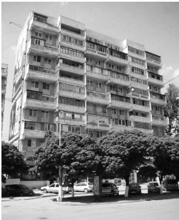
obr. 1 - Kišiňev, Ciocana, ulice Alleea Mircea cel Batran

20. století, jimiž mnohdy dojde ke kompletnímu obestavení jedné nebo více fasád domu (obr. č. 3).