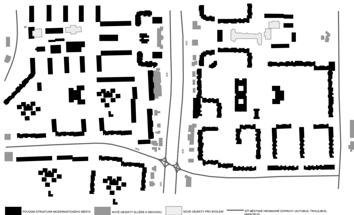
obr. 6 – Kišiněv (Moldávie), sídliště Ciocana, nárůst urbanizace, obchodních ploch a služeb podél veřejné dopravy