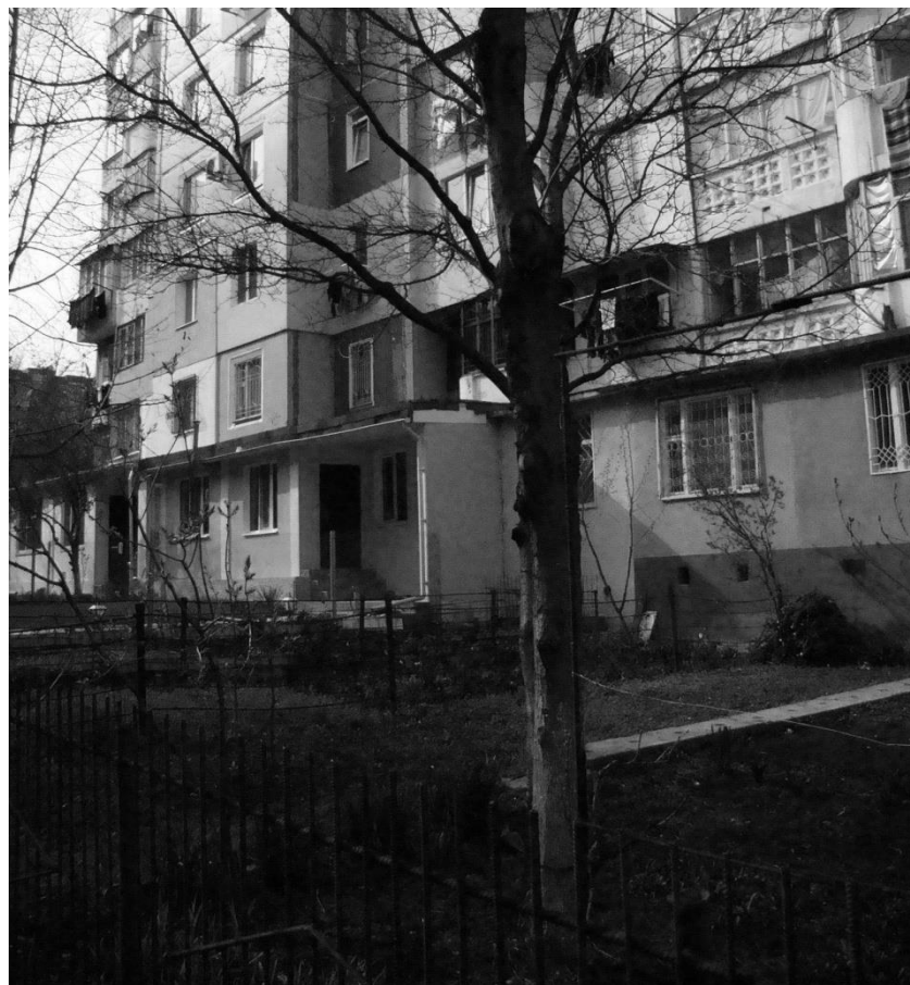
obr. 4 – Kišiňev, ulice Alleea Mircea cel Batran, Ciocana, Moldávie, vnitroblok

V reakci na přílišné rezervy a vzdálenosti velkoryse plánovaných modernistických sídlišť, kde hlavní dopravní tepny tvoří široké bulváry, dochází nově ke vzniku celých „představených“ ulic (obr. č. 5–7). Většinou jsou tvořeny jedno až dvou podlažními objekty výhradně obchodního charakteru či poskytování služeb. Přirozeně tak vznikají nové obchodní třídy a ulice nesoucí znaky, které lze zahrnout do pojmu „městotvorné“, a které spoluvytváří svébytná a plnohodnotná centra na periferiích měst.