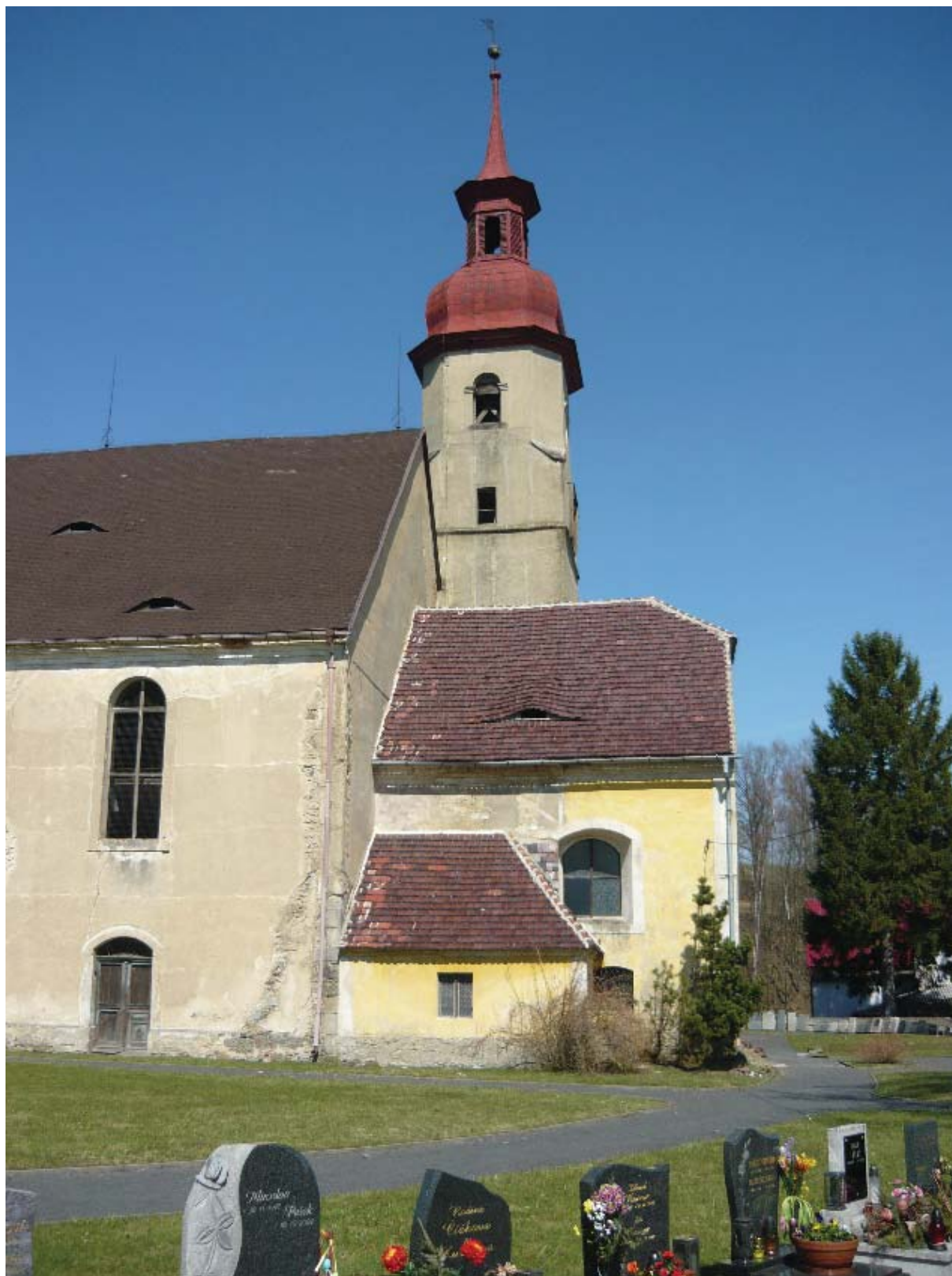
obr. 2 – Kostel sv. Ducha ve Višňové, okres Frýdlant